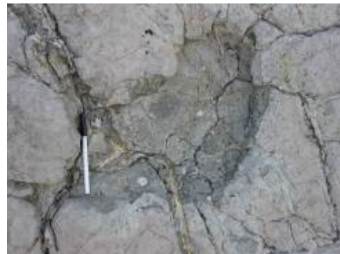
Ababuj. Izquierda, yacimiento de icnitas de dinosaurios del Jurásico Superior (Formación Villar del Arzobispo) "Ababuj-1", derecha: huella atribuida a un dinosaurio saurópodo.