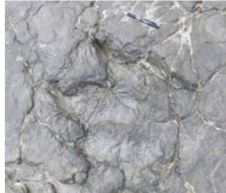
El Castellar. Izquierda: vista general del yacimiento de icnitas de dinosaurios del Jurásico Superior (Formación Villar del Arzobispo) "El Castellar"; derecha: icnita terópoda de este mismo yacimiento, el holotipo de Iberosauripus grandis .