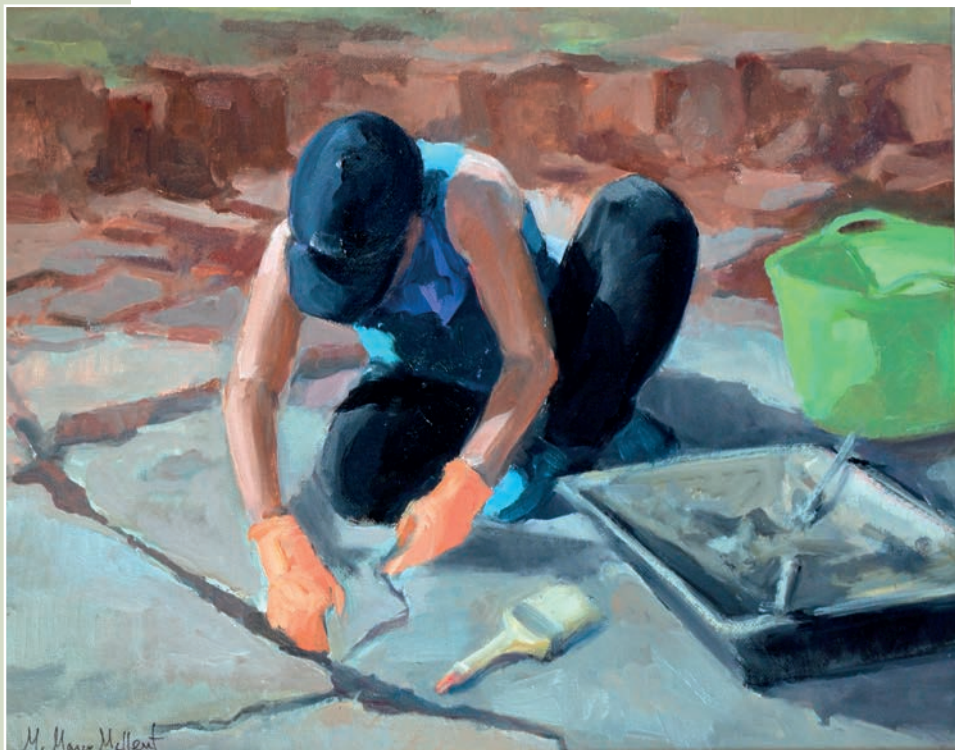
Pintura de la serie "En el yacimiento", óleo sobre tablillas enteladas, 33x41 cm.

El paisaje sin figura ha sido también motivo de interés, pues la composición del suelo en el que se ubican los yacimientos y la vegetación que los cubre permite un estudio pictórico complejo, atendiendo sobre todo a los contrastes de luz y la modulación del color. Los verdes pardos del pinar y el sabinar frente a la grisácea roca caliza, la rosada piedra de arenisca y las arcillas verdosas, ocres o rojas, forman una paleta sugerente de color que además va adquiriendo diferentes matices conforme varía la luz del sol a lo largo del día. Todo un reto enormemente atractivo para una artista del paisaje.