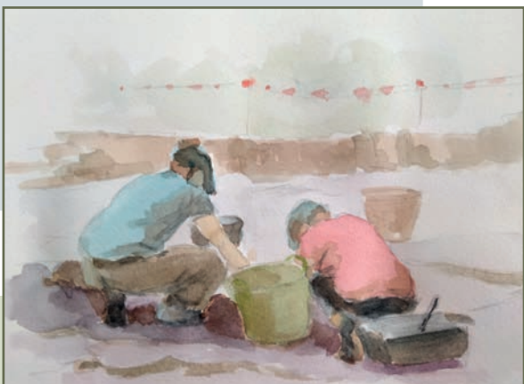
Bocetos con nogalina y acuarela sobre papel, 15x21 cm.