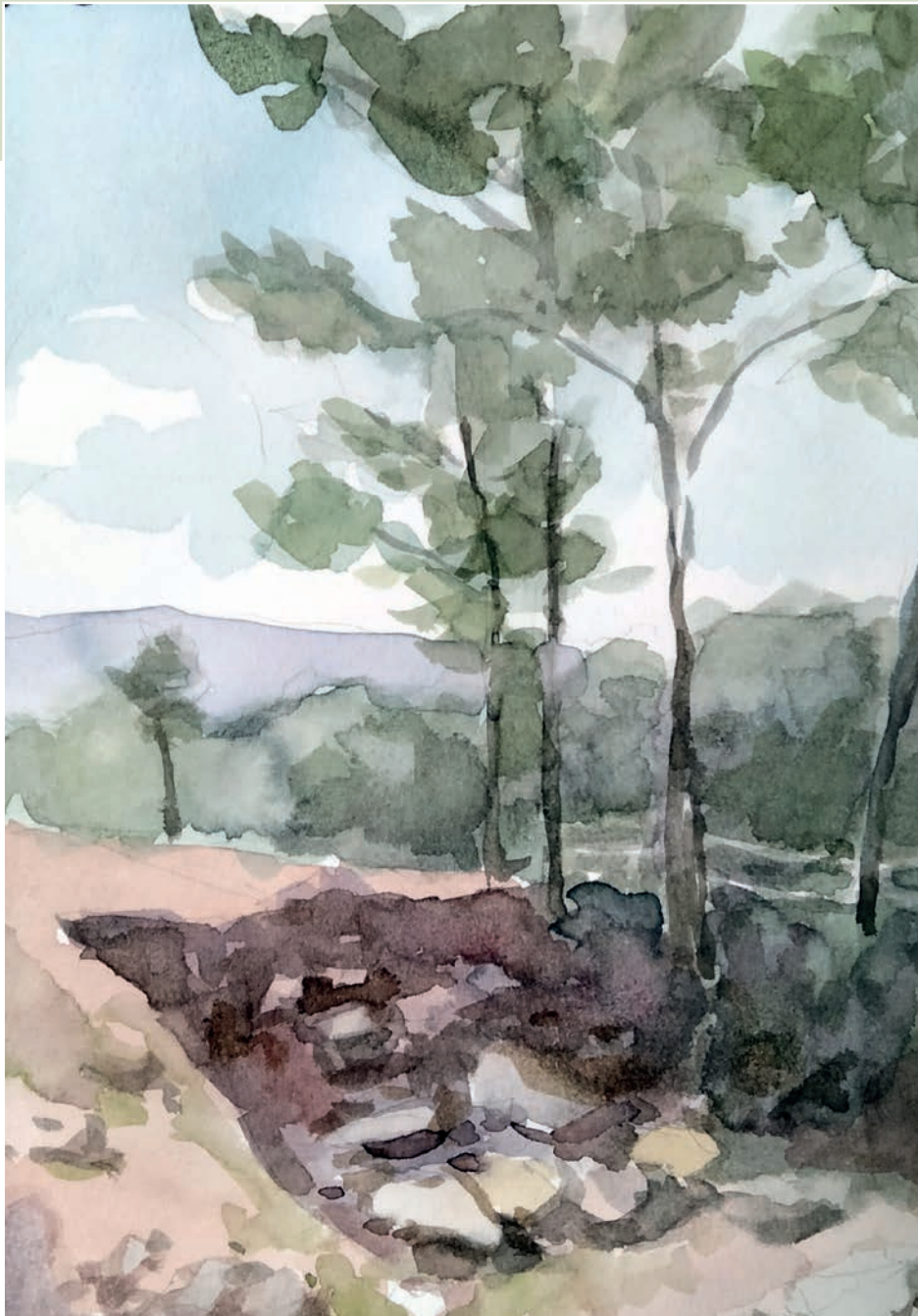
Estudio preliminar con acuarela para paisaje del yacimiento "El Hoyo" (obra en portada), 21x15 cm.