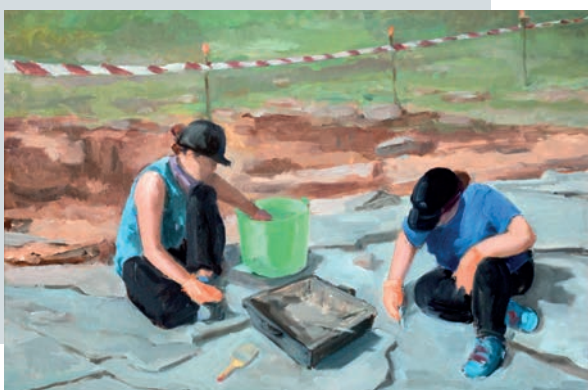
Dibujo previo a la mancha de color con carboncillo sobre tablilla entelada de 33x41 cm, acabado final con óleo.