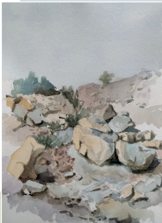
Apunte del natural con detalle de rocas y arcillas. Acuarela sobre papel, 32x24 cm.

natural. Cada color está compuesto por diferentes pigmentos mezclados con un aglutinante (goma arábica) y un elastómero (glicerina) diluibles en agua. Es una técnica de secado rápido por lo que permite la aplicación de diferentes capas de color en un tiempo breve. La he utilizado para el apunte de paisaje preferentemente sobre los soportes de papel ya mencionados.