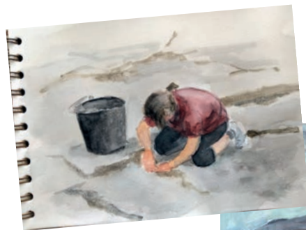
Estudio en acuarela y pintura de la serie “En el yacimiento”, óleo sobre tablillas enteladas, 33x41 cm.

Los materiales utilizados para los bocetos del natural han sido principalmente el lápiz de grafito, la acuarela y la nogalina sobre papel. Para la obra final y algún apunte, el óleo sobre tela o sobre tablillas enteladas.