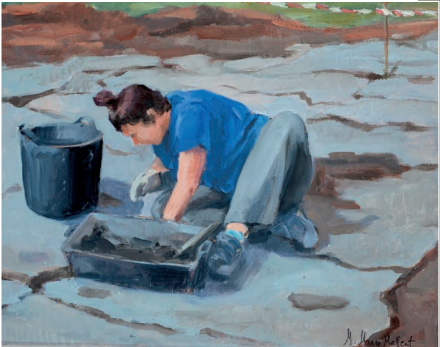
Pintura de la serie "En el yacimiento", óleo sobre tablillas enteladas, 33x41 cm.

Estas pinturas han sido concebidas en campo abierto ante un entorno natural y campestre. Tal y como entendemos hoy en día el término paisaje podemos afirmar que se trata de un análisis paisajístico, difícilmente asimilable a un estudio científico. Aunque ha sido inevitable pensar en la relación que siempre hubo entre