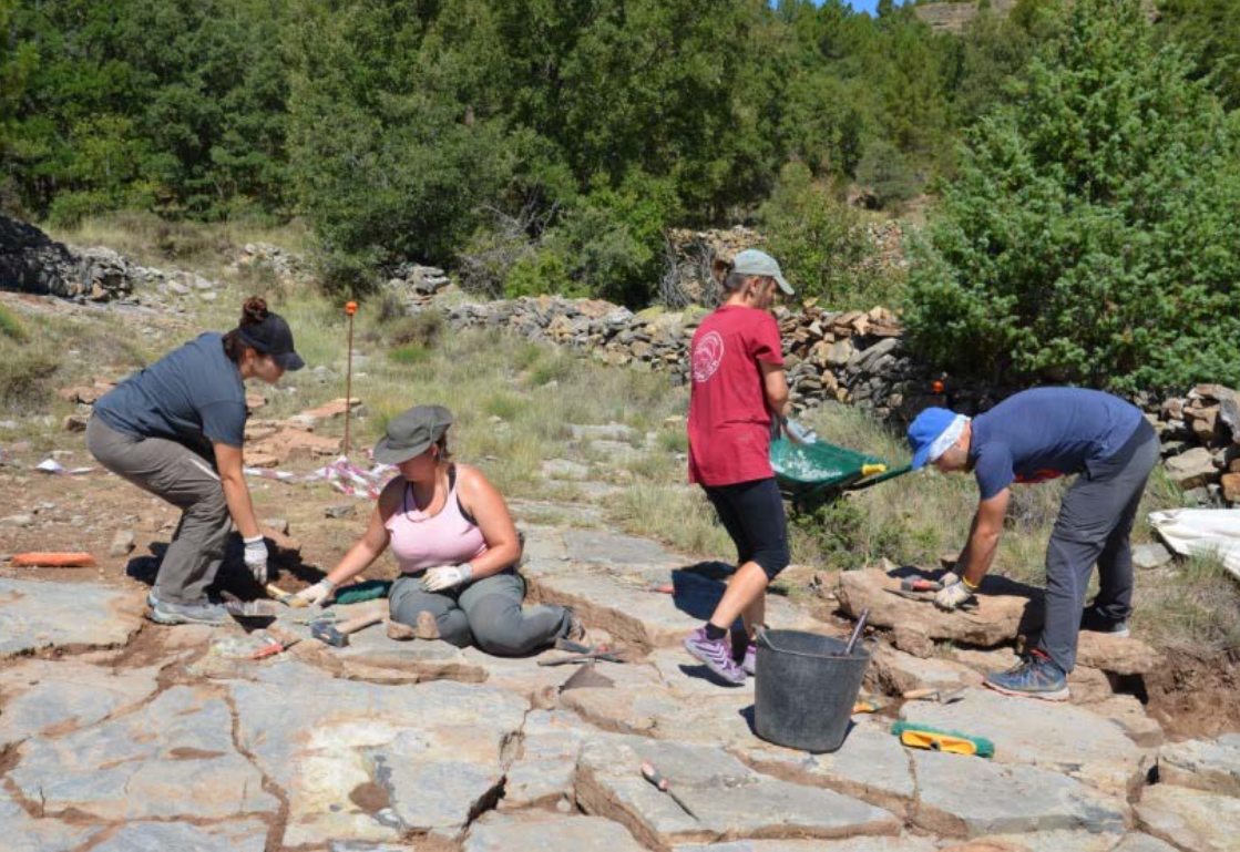
Trabajos paleontológicos en el yacimiento "El Pozo".

investigadores, científicos, exploradores y dibujantes en históricas expediciones por el medio natural o en colaboraciones didácticas y divulgativas actuales, solo en la medida en que mi visión aporte información que no es evidente para el observador, podría considerarse un trabajo de ilustración válido para el investigador. Sin embargo, sí supone un estudio riguroso en el ámbito de las Bellas Artes.